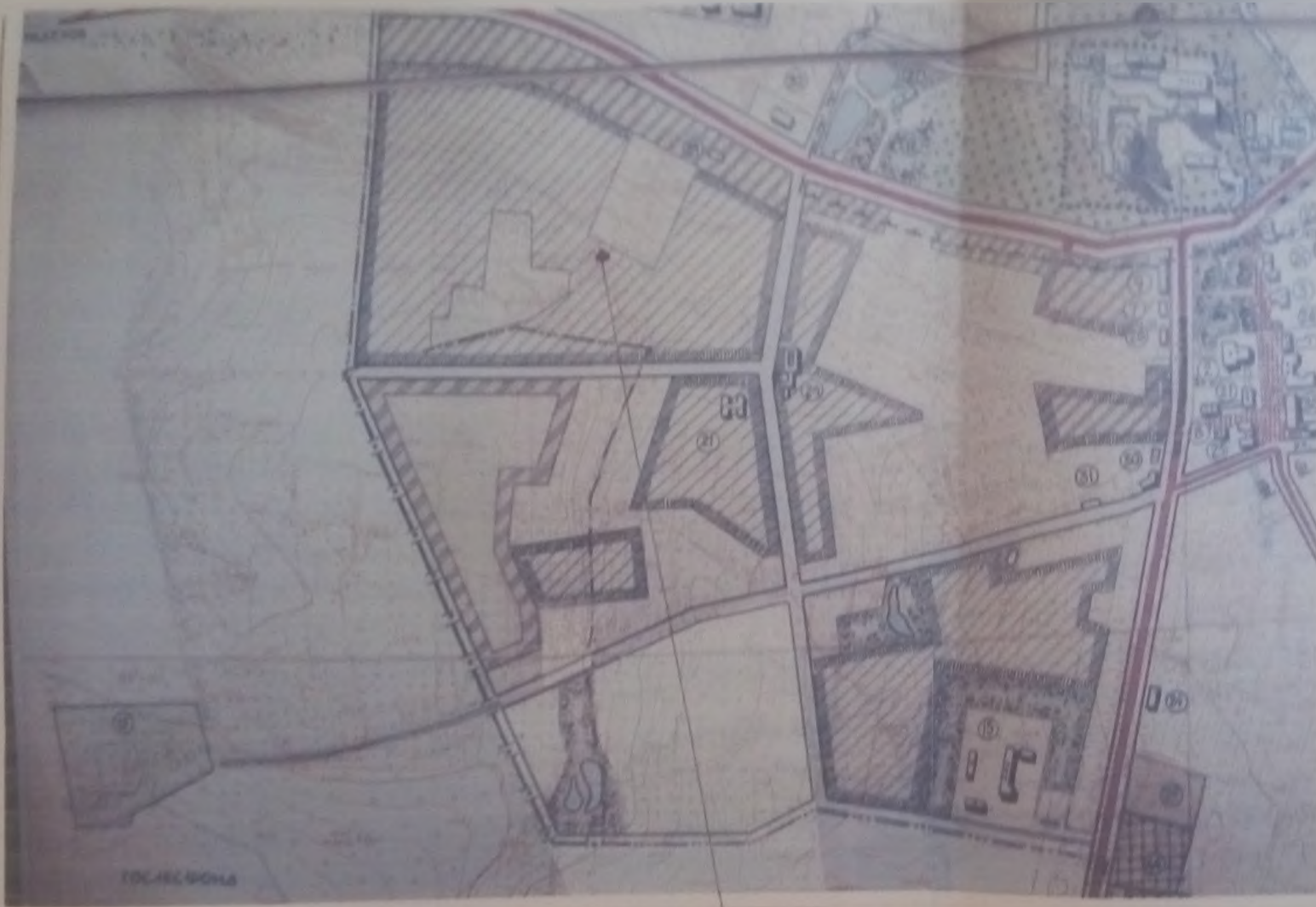
місце розташування земельної ділянки