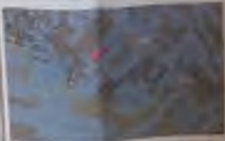
Схема розташування території у планувальній структурі м.Почаїв (випокійвання з публічної кадастрової карти)

ПРОГРАМ ГЕНЕРАЛЬНИЙ ПЛАН м. ПОЧАЇВ 1:5000 МІСЬКА РАДА ПОЧАЇВСЬКОЇ ОБЛАСТІ