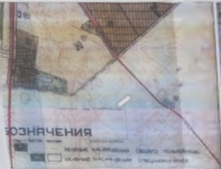
Схема розташування території у планувальній структурі м.Почаїв (фрагмент генерального плану) М 1:5000

ПРОГРАМ ГЕНЕРАЛЬНИЙ ПЛАН м. ПОЧАЇВ 1:5000 МІСЬКА РАДА ПОЧАЇВСЬКОЇ ОБЛАСТІ