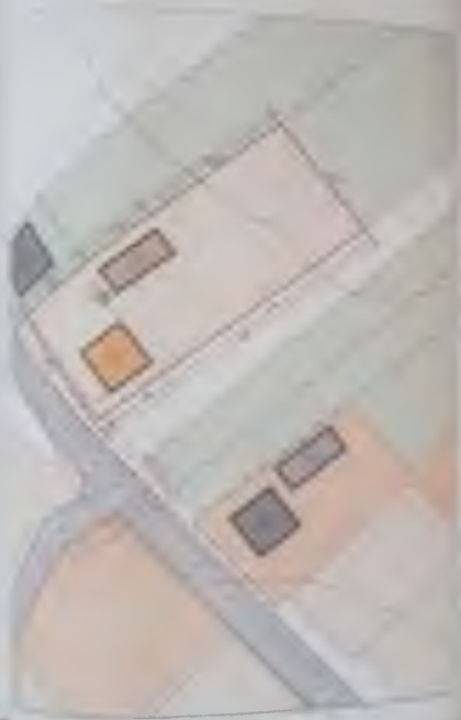
Схема инженерних мереж, споруд і використання підземного простору М 1:500