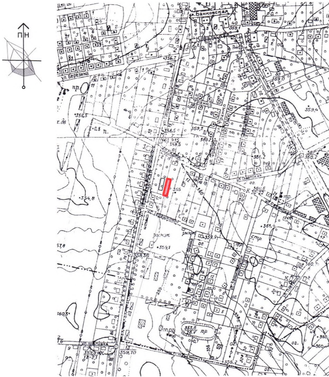
місце розташування земельної ділянки