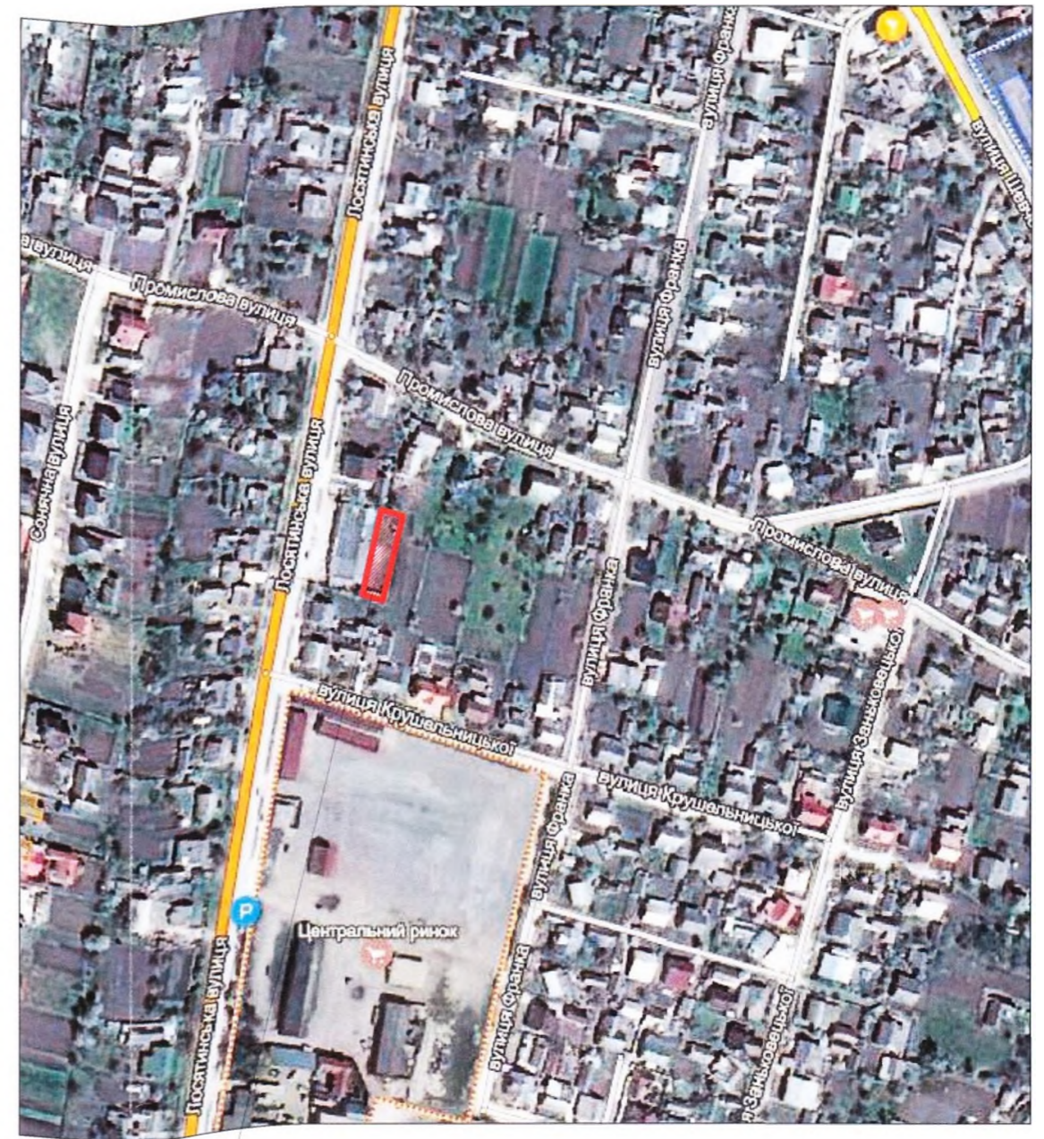
місце розташування земельної ділянки